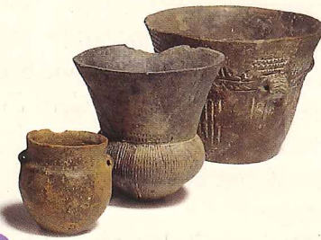
Aan de vorm van de middelste beker kun je zien hoe het Trechterbekervolk aan zijn naam komt.

Om het graf werd er nog een kring van stenen gelegd. Het hunebed kreeg een ingang. En tot slot werd het helemaal bedekt met zand. Zo leek het op een zandheuvel.