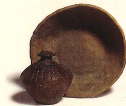
Aardewerk van het Trechterbekervolk.

Dan maakten ze een helling van zand tegen de muur. Zo maakten ze de heuvel groter. Daarna sleepten ze een grote platte steen over de zandhelling omhoog. Dat is het dak.