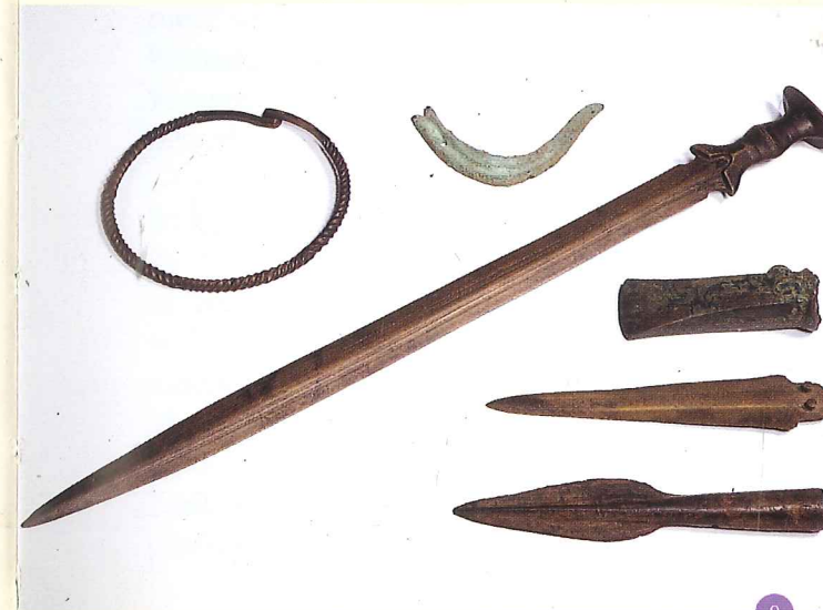
Gevonden spullen uit de Bronstijd.