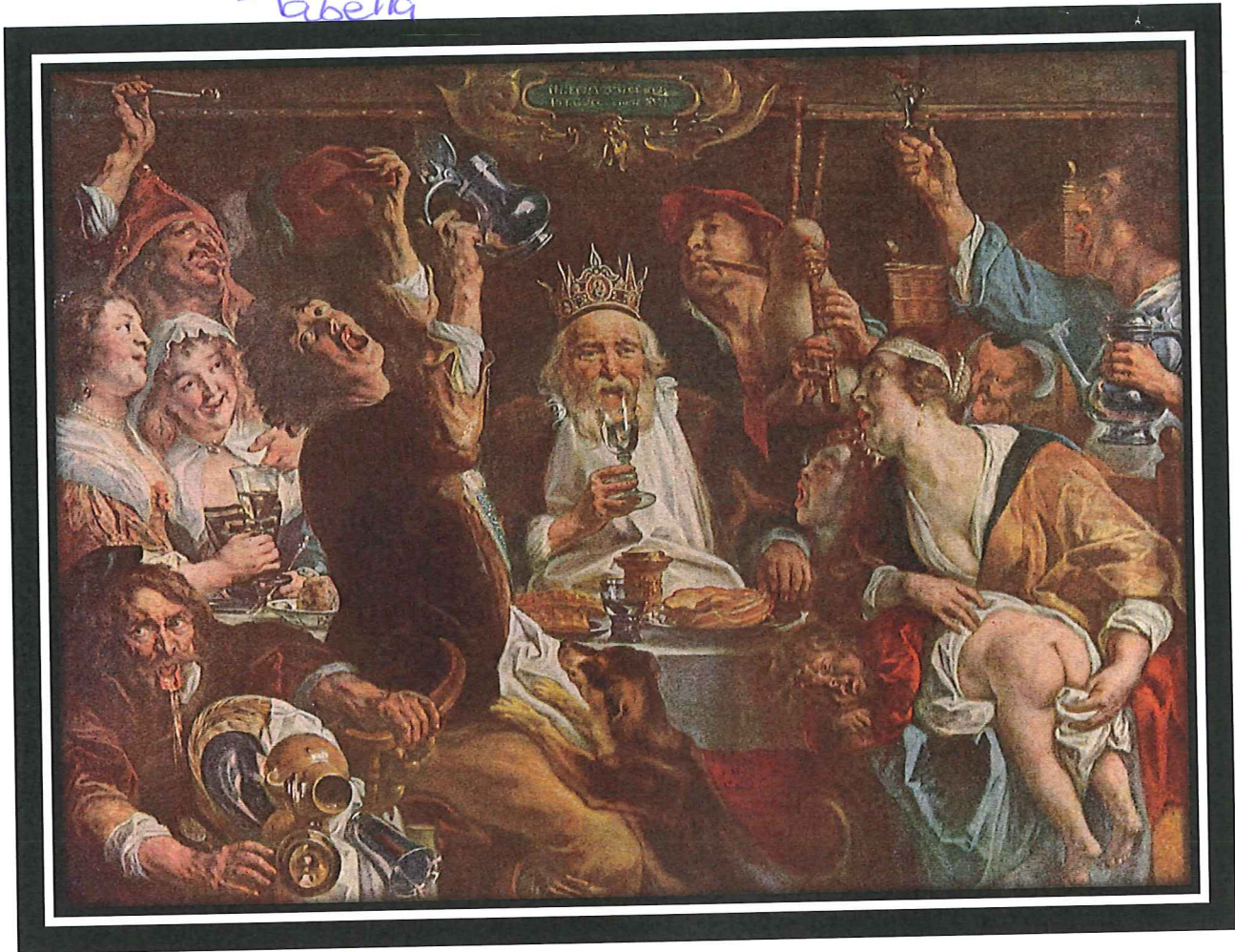
feest bij de koning.

Vandaag gaat de klas van Anna naar het museum, Maar kim Rosa en Bibi vinden het saai. Als ze er zijn staan ze de grote hal daar is een groot schilderij het heet feest bij de koning. er staat een verhaal bij heereeeeel lang geleden was er een groot feest met wijn, Waarom is de hond daar vraagt kim op die wandie oma zegt anna. De vrouwen waten vertiejd op de koningen hij zels dronk wijn mensen vielen opelkaar eentje spagte endie billen zijn oandie prins. Zien jullie die man daar hij walt op die vrouwen die wullen op die spugende man, endie man die muziek maakt verslikt zich en het feest zelf word een Chaos. Mensen dronken tonnen wijn en koning ook het was s zijn eerste keer endie oma is de koning zijn moeder Zo zeggende de 3 meiden in een koor Ik ga nooit wijn drinken.